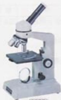
2203 FM-900 with plastic case