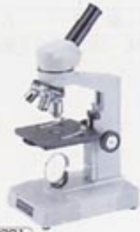
2201 FM-600 with plastic case