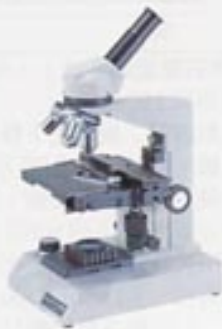
2205 FM-1500 with plastic case